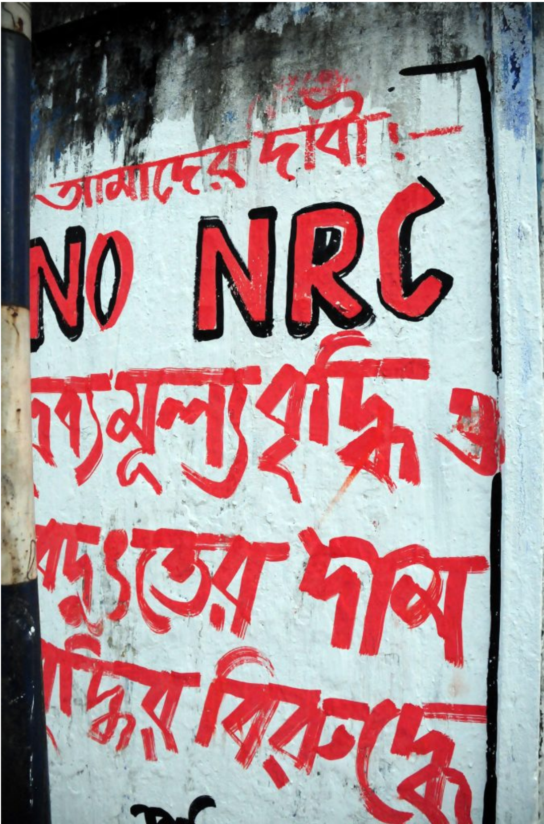
Σύνθημα ενάντια στο