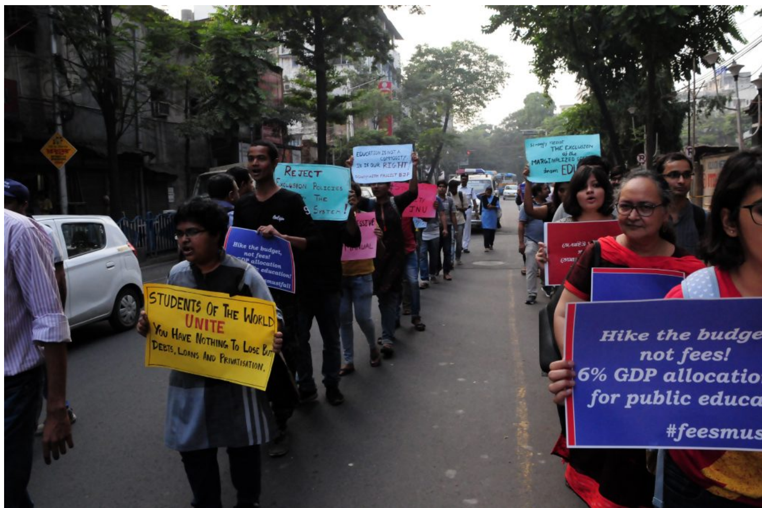
Διαδήλωση των αποφοίτων του JNU στην Καλκούτα ενάντια στην εκπαιδευτική μεταρρύθμιση της κυβέρνησης Μόντι, Νοέμβριος

Έπειτα, το κίνημα για τον Rohith Vemula, έναν σύντροφό μας, φοιτητή Ντάλιτ από το Κεντρικό Πανεπιστήμιο του Hyderabad, ο οποίος αυτοκτόνησε μετά από πολύμηνο αγώνα. Εμείς είπαμε πως δεν επρόκειτο για αυτοκτονία, αλλά για θεσμική δολοφονία λόγω των τεράστιων διακρίσεων που αντιμετώπιζε όχι μόνο εντός του Πανεπιστημίου και των φοιτητικών εστιών, αλλά και από την πανεπιστημιακή διοίκηση και την κυβέρνηση εξαιτίας των πολιτικών του πεποιθήσεων. Ο θάνατος του Rohith Vemula ξεσήκωσε ένα μεγαλειώδες κίνημα που ζητούσε δικαιοσύνη για τη δολοφονία του.